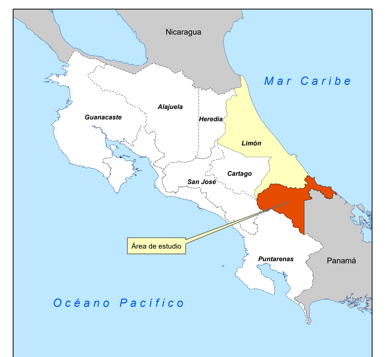
Diagrama de Ubicación