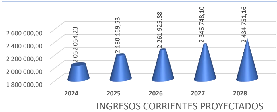
CUADRO N° 5 REPRESENTACION GRAFICA DE LOS INGRESOS CORRIENTES CRECIMIENTO PROYECTADO DEL 2024 AL 2028